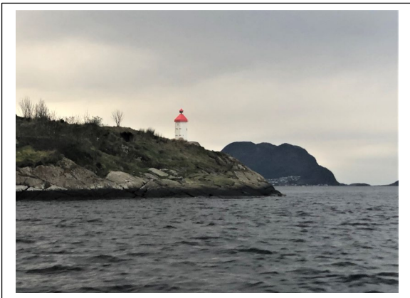
Litus MINI - Dagtid