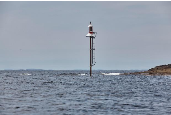
Dirigens MINI – Dagtid