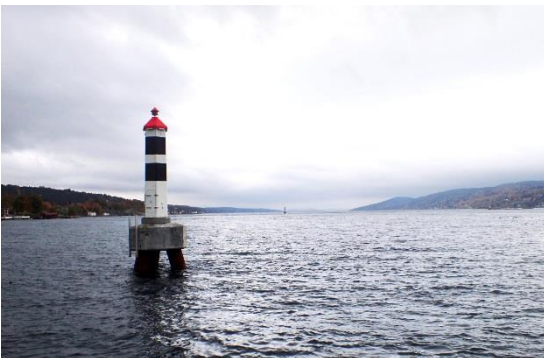
Litus LUX – Dagtid – På fundament i sjø