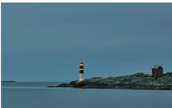
Litus LUX – Kveldstid – På land

Litus Lux er en fyrlykt utviklet av Kystverket. Foruten å være Kystverkets primære sektorlykt, kan den utstyres med fasadebelysning (indirekte belysning) og kan også benyttes til ytterkantmarkering i seilingskorridor.