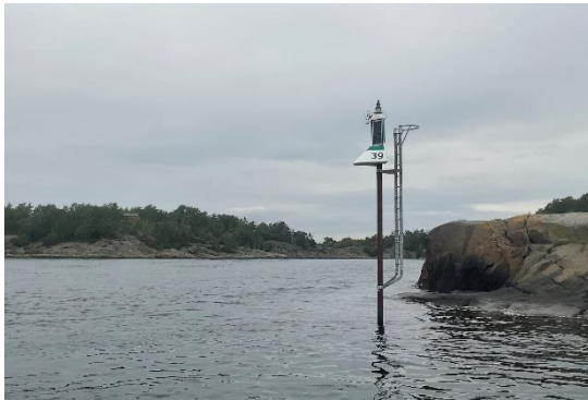
Dirigens MINI – Dagtid