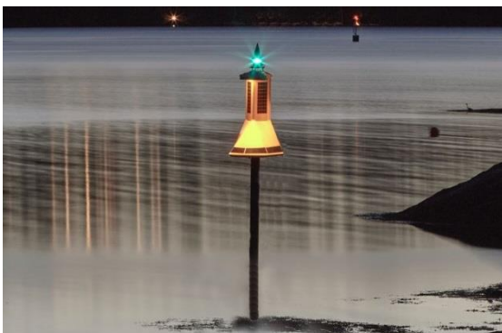
Dirigens MINI – Nattestid

Dirigens MINI er en lanterne med indirekte belysning utviklet av Kystverket. Installasjonen er en mindre utgave av Dirigens LUX.