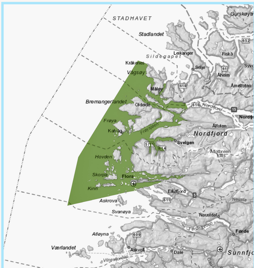
Tjenesteområde for Kinn sjøtrafikksentraltjeneste